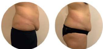
Локални мазнини и отпусната кожа Клиничен случай от Румъния