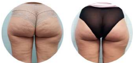
Целулит и локални мазнини Клиничен случай от Италия