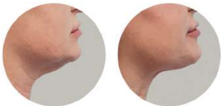
Двойна брадичка Клиничен случай от Италия