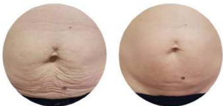
Локални мазнини и отпусната кожа Клиничен случай от Италия