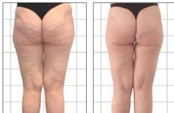
Преди/След една процедура с Onda

“Onda селективно третира подкожните мазнини без термично действие върху горния слой на кожата. Тук не говорим просто за охлаждащ ефект от края на крака, а за първи път имаме възможност фокусирано да третираме конкретни зони единствено там, където това е нужно.”